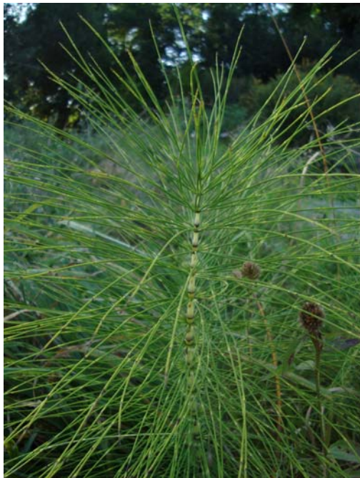
Cola de Cabalo (Equisetum telmateia)

Aceite para masajear zonas doloridas. Actúa en dolores reumáticos, esguinces, contusiones, dolores musculares y articulares. Posee acción antiinflamatoria, analgésica, rubefaciente, antiespasmódica. Composición: Aceite de almendras, Alcanfor, Extractos de Harpagofito, Romero, Árnica y Sauce, Aceite esencial de Pino y Clavo.