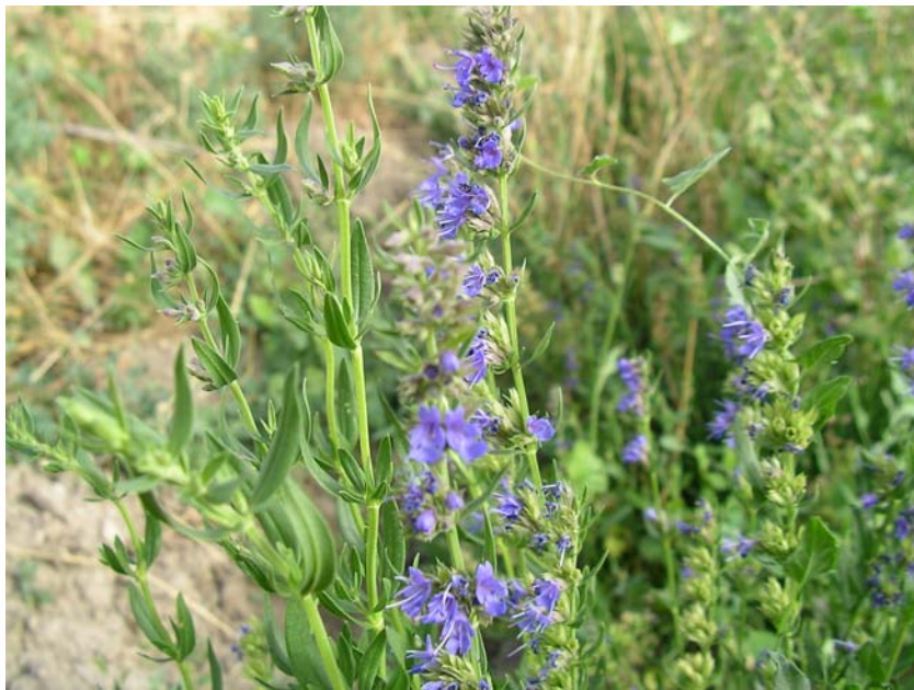
Hisopo ( Hyssopus officinalis )

Verter 200ml. de agua hirviendo sobre una cucharadita de la mezcla de plantas y dejar reposar durante 5-10 minutos. Colar con filtro de papel o tela , edulcorar al gusto. Tomar 2 - 3 infusiones al día.