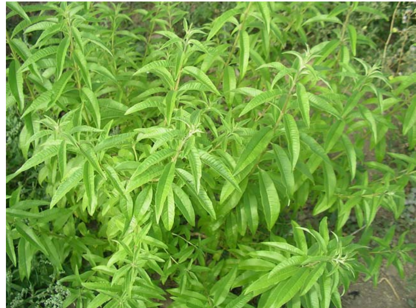
Hierbaluisa ( Aloysia tryphilla )

Verter 200ml. de agua hirviendo sobre una cucharadita de la mezcla de plantas y dejar reposar durante 5-10 minutos. Colar con filtro de papel o tela , edulcorar al gusto. Tomar 2 a 3 infusiones al día.