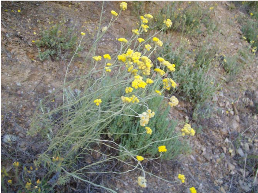
Helicriso (Helycrisum stoechas)

Alivia el picor y reduce la inflamación de la piel hidratándola. Indicado en caso de picaduras de insectos (especialmente los mosquitos) y otras inflamaciones de la piel que producen picor. Ingredientes: Aceite de almendras, cera de abejas, Caléndula, Helicriso y aceite esencial de menta.