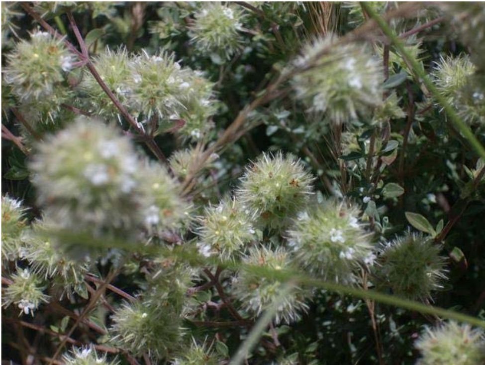
Tomillo (Thymus mastichina)

Se usa también como limpiador facial y tónico estimulante de la circulación capilar.